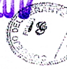
Fig3: Propuesta 2:

Construccion derivador transito sobre av. Belgrano y Tucuman y cambio de sentido calle Peru y Av. Inmigrantes